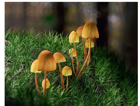
Psilocybinhaltiger «Kahlkopf» oder Magic Mushroom.